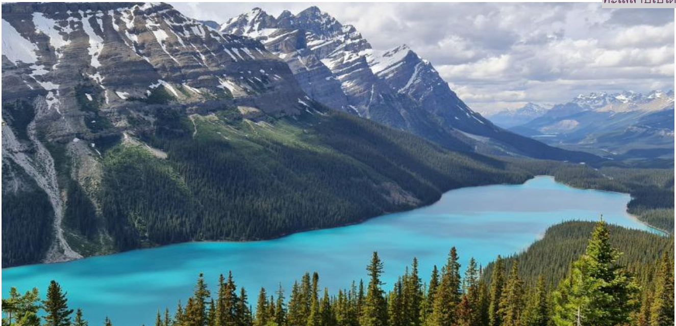
ทะเลสาบเปโต